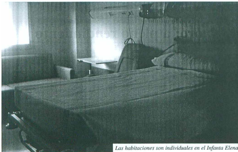
Las habitaciones son individuales en el Infanta Elena

En cuanto al personal que está trabajando en el hospital, se puede decir que entre médicos, enfermeras, auxiliares y personas de limpieza hay 460 personas, con capacidad para ampliar más las plantillas, debido a la apertura de nuevos módulos próximamente.