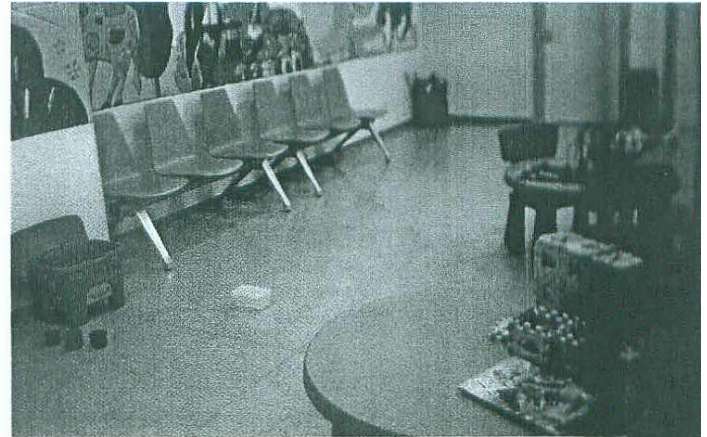
Sala de espera infantil.

En este aspecto, el Hospital Infanta Elena dispone de todo tipo de aparatos para realizar los ejercicios que necesitan sus pacientes, según informan fuentes hospitalarias a la revista ZIGZAG. Además, próximamente el centro podría recibir la colaboración del Ayuntamiento de Valdemoro, que facilitaría las instalaciones de la piscina cubierta a los pacientes del Hospital Infanta Elena que lo necesiten.