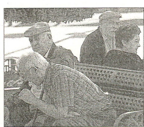
La depresión aparece frecuentemente en mayores de 65 años.

El equipo ha relacionado el hecho de que en los depresivos la secreción de insulina en el páncreas es menor, lo que hace que los niveles de glucosa en la sangre sean elevados, pero no pueda ser utilizada en órganos periféricos. "Cuando se sufre depresión el organismo intenta mantener glucosa en el torrente sanguíneo, ya que la necesita para producir energía de modo inmediato", ha señalado Carnethon. Este mecanismo bloquea la acción de la insulina, con lo que el paciente puede incluso seguir produciendo glucosa al no ser capaz de utilizarla pues su organismo piensa que no está