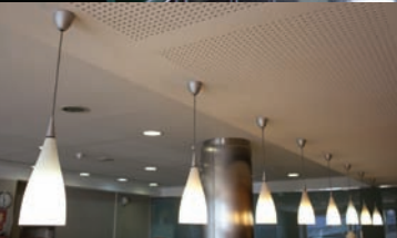
Detalle interior de Hospital de día Quirón Zaragoza