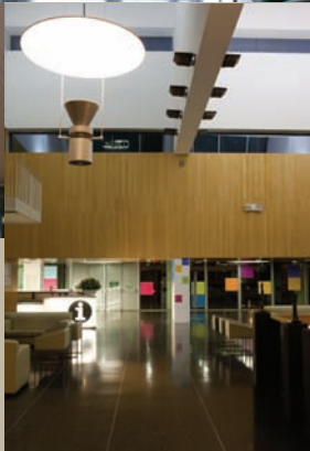
Detalle de hall principal de Hospital Quirón Barcelona