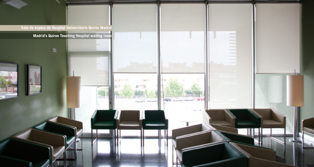
Madrid's Quiron Teaching Hospital waiting room