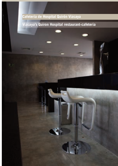
Vizcaya's Quiron Hospital restaurant-cafeteria