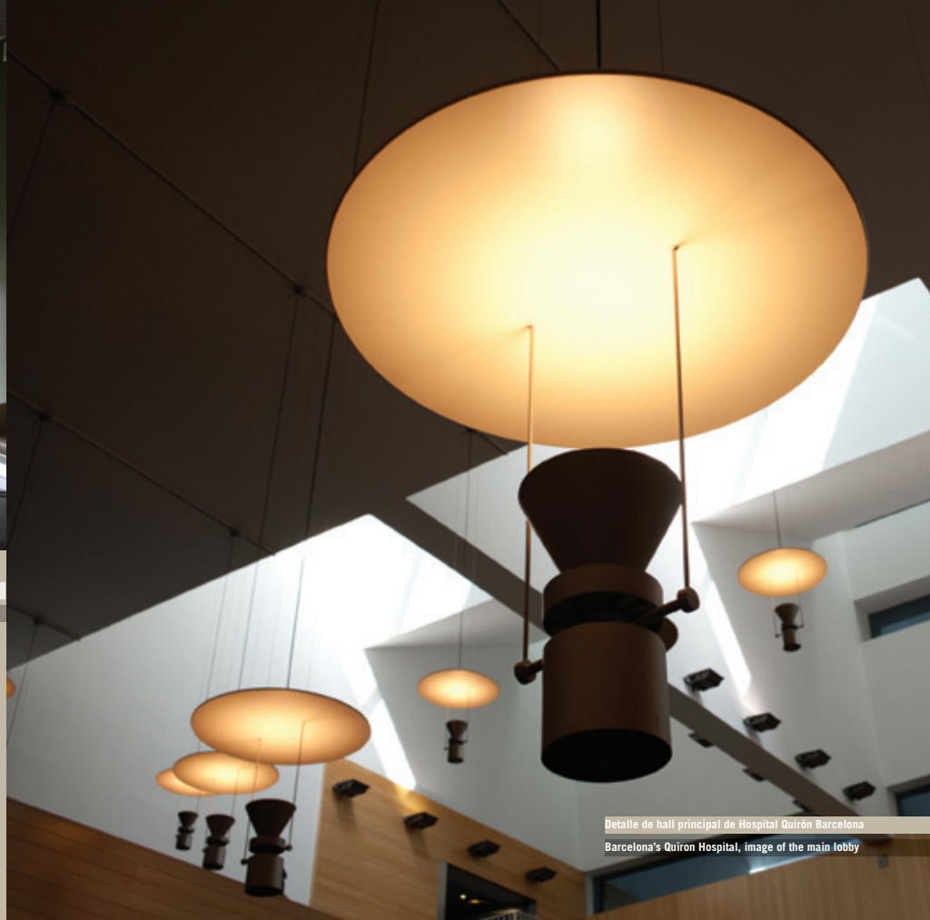
Detalle de hall principal de Hospital Quirón Barcelona