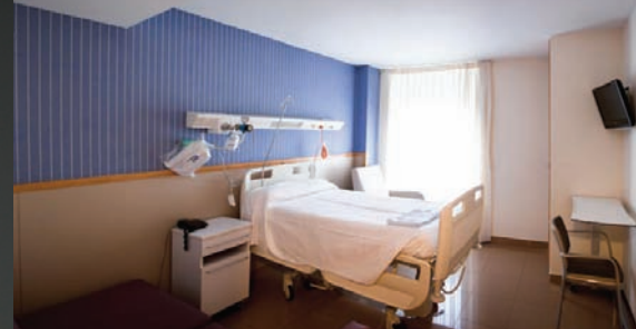
Habitación de Hospital Quirón San Sebastián San Sebastian's Quiron Hospital room