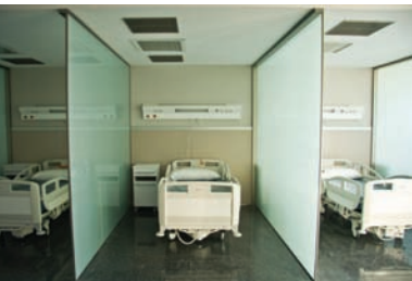
ICU at Vizcaya's Quiron Hospital