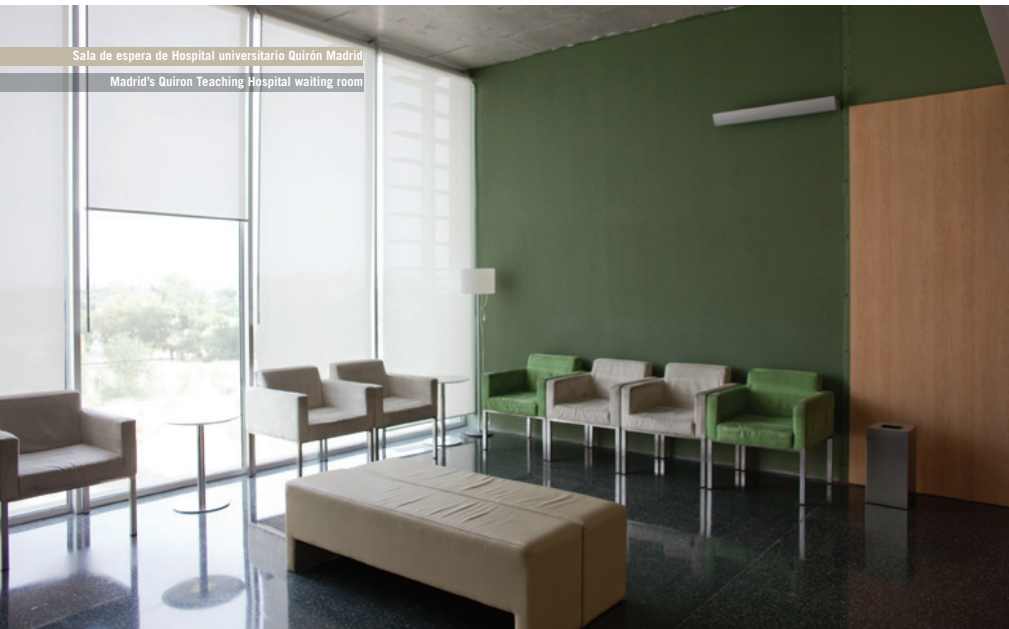
Sala de espera de Hospital universitario Quirón Madrid Madrid's Quiron Teaching Hospital waiting room