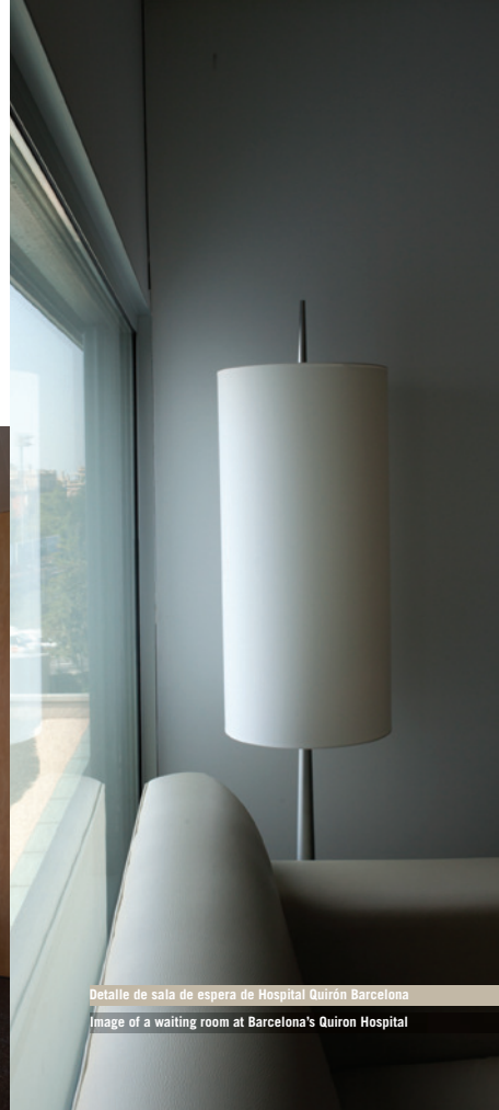
Detalle de sala de espera de Hospital Quirón Barcelona Image of a waiting room at Barcelona's Quiron Hospital