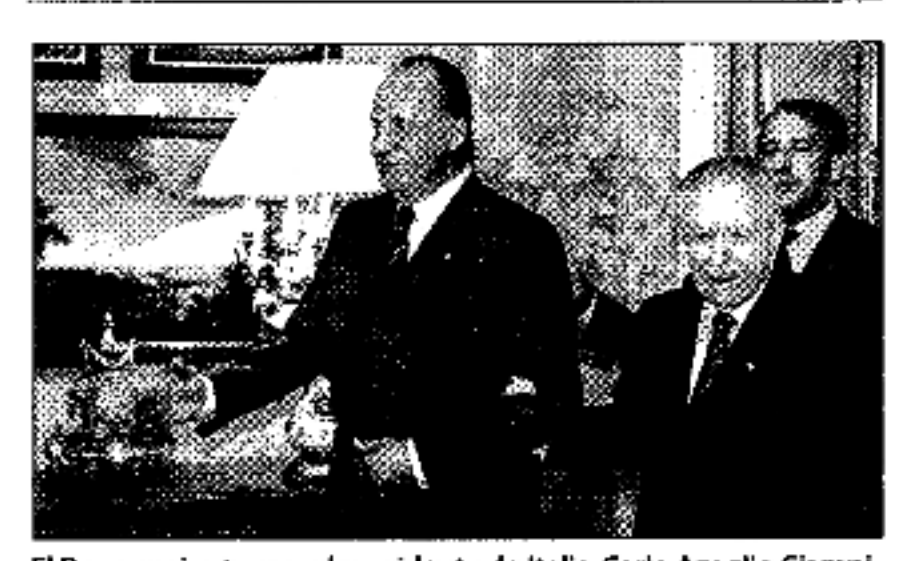
El Rey, ayer, junto con el presidente de Italia, Carlo Azeglio Ciampi.

Actualmente, un centenar de jóvenes procedentes de España y otros países cursan sus estudios en las distintas cátedras, una enseñanza que se complementa con la presencia de grandes maestros invitados a compartir lecciones magistrales y con la participación de los alumnos en cerca de 200 conciertos públicos por salas de toda España.