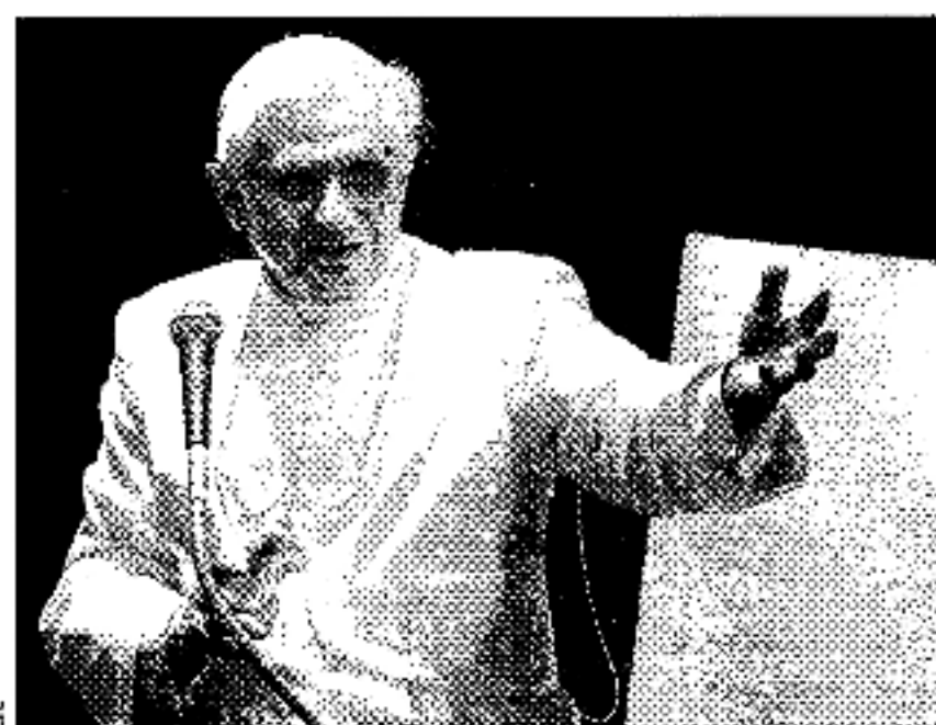
El Papa, en el Aula Pablo VI durante la audiencia de ayer.