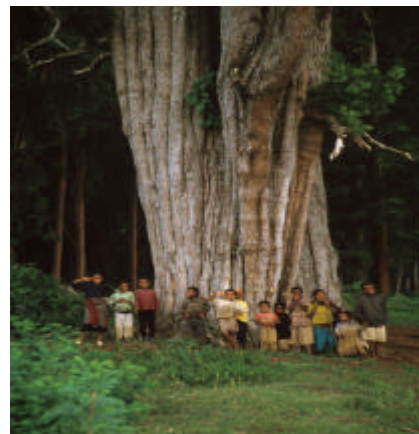
Entorno natural del hospital de Gambo