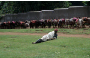
"Aparcamiento" del hospital de Gambo