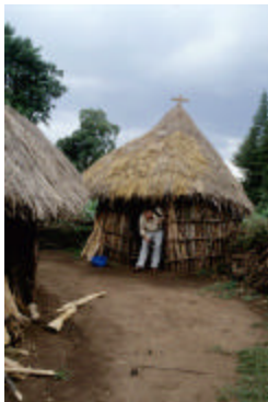
Choza en un poblado cercano al hospital