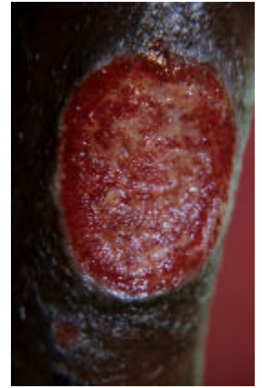
Ulcera tropical en un paciente hospitalizado