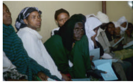
Sala de espera de la consulta externa del hospital