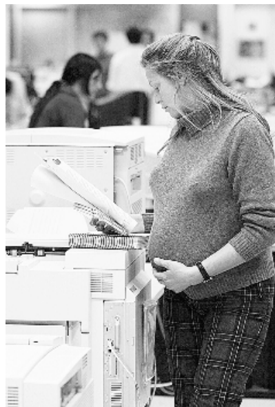
El clima de trabajo se hace insostenible para demasiadas embarazadas

El presidente de la Fundación Madrina señala que el empresario considera que, con su maternidad, las «prioridades vitales» de estas mujeres han cambiado al decidir ser madres, y piensa que no se ocuparán de igual manera de las tareas profesionales. «Para todas, el problema de la flexibilidad de horarios, el acceso a guarderías gratuitas y el apoyo psicosocial es determinante en su estabilidad laboral», precisa. Asimismo, indica que más del 65 por ciento de las mujeres que se acercan a esta organización