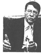
El ministro Jordi Sevilla.

Sueldo, como mínimo, de mil euros: con un horario que permita conciliar vida familiar y laboral y en la mayor empresa del Estado. La oferta es tentadora y es la que se ha empeñado en desarrollar el ministro de Administraciones Públicas, Jordi Sevilla, que presentó el viernes 33.151 plazas para ser funcionario con estas condiciones. Para él, trabajar en la Administración "no es un chollo, pero sí una muy buena oportunidad" y así quiere que la vean miles de españoles que tengan intención de presentarse. Calculan que lo harán 250.000.