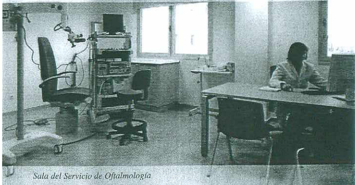
Sala del Servicio de Oftalmología

«La filosofía del Hospital Infanta Elena: proporcionar una asistencia sanitaria de calidad, rápida y resolutiva, de forma personalizada y cercana».