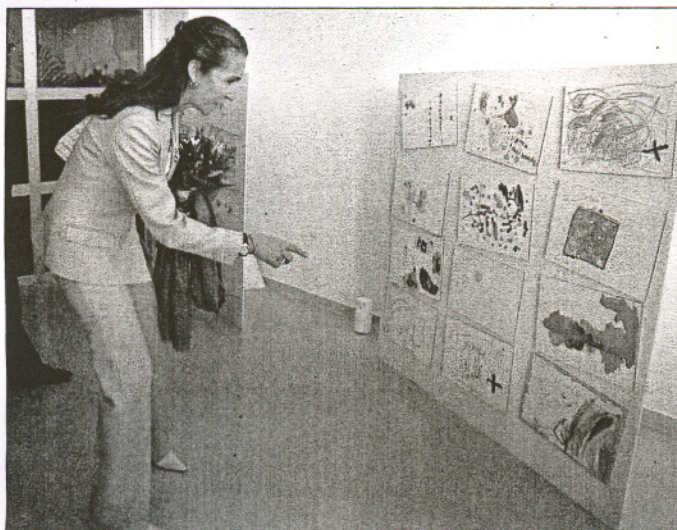
La Infanta Elena, contemplando una muestra de trabajos infantiles.

parto y recuperación, lo que permitirá que las madres de Valdemoro y de su área de influencia no tengan que desplazarse hasta el Hospital 12 de Octubre para dar a luz, ya que podrán hacerlo cerca de sus hogares.