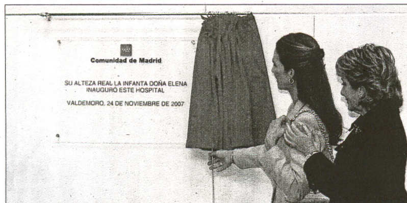
La Infanta Elena junto a Esperanza Aguirre en el momento de descubrir la placa de inauguración del hospital.

El centro cuenta con áreas de hospitalización, urgencias, asistencia ambulatoria, servicios diagnósticos, logística y servicios generales. Además dispone de seis quirófanos, dos salas de parto y recuperación, 35 puestos de