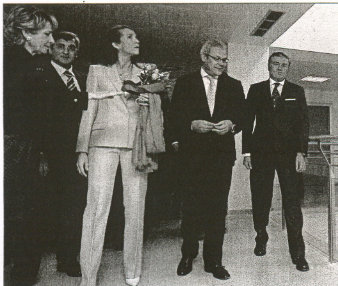
La Infanta Elena, escuchando la explicaciones de la presidenta.

• El sur de Madrid cuenta con un nuevo hospital. La infanta Elena, acompañada por Esperanza Aguirre y por el Consejero de Sanidad, Juan José Güemes inauguró el Hospital Infanta Elena de Valdemoro. El centro dará servicio a más de 100.000 personas, tiene una superficie de más de 45.000 metros cuadrados y está preparado con las últimas tecnologías para la atención a los pacientes. A la inauguración asistió un gran número de personalidades.