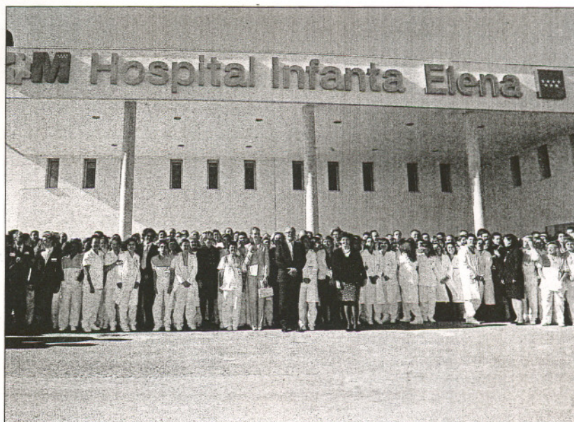
Autoridades y profesionales, el día de la inauguración.