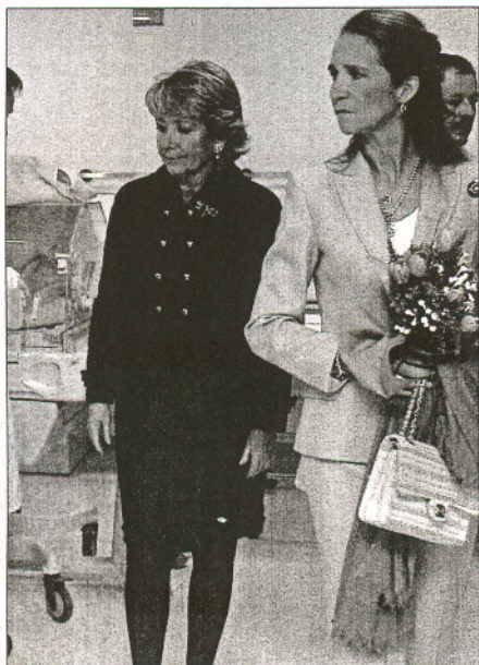
La Infanta Elena y Esperanza Aguirre, durante su visita.

Dispone inicialmente de un total de seis quirófanos, dos salas de parto y recuperación, 35 puestos de urgencias entre "boxes" y puestos de atención y observación; 38 consultas externas, 42 gabinetes de exploraciones, 10 salas de radiología y 28 puestos de diálisis. Igualmente, el hospital contará con las especialidades médicas y quirúrgicas necesarias, destacando especialmente la incorporación de las especialidades materno-infantiles, con dos salas de