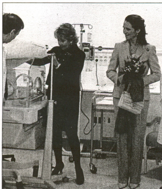
La presidenta, acompañada de la Infanta Elena y el consejero, revisando el material

Por su parte, los profesionales que ya trabajan en este centro destacan la amplitud de este nuevo centro así como la alta tecnología de la que dispone el hospital.