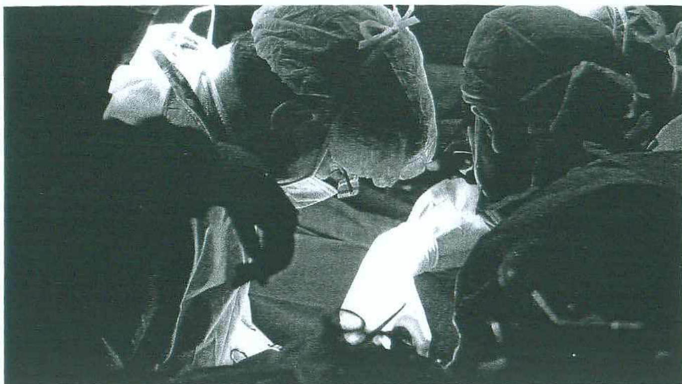
La cuarta parte de los más de 200.000 médicos que trabajan en España tiene más de cincuenta años.