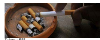
Tabaco / EFE

Los contactos, camuflados entre anuncios de trabajo