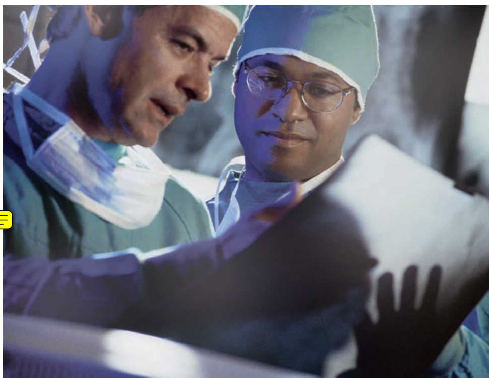
Cada vez más servicios regionales de salud alcanzan acuerdos con clínicas y hospitales privados para prestar atención.

El peso del sector privado en la salud de los españoles casi llega al 30% del total, lo que ha provocado el interés de grandes grupos empresariales de gestión hospitalaria como USP, Capiro, Nisa o Quirón, además de aseguradoras como Asisa, Sanitas, Adeslas, DKV o Mapfre Caja Salud. La presencia de grupos de capital riesgo en empresas privadas de gestión hospitalaria, como es el caso de Cinven en el capital de UPS o de Apax Partners en el de Capiro se explica por el fuerte potencial de crecimiento del sector, la característica anticíclica del negocio -que se resiente poco en momentos de crisis económica como ocurre en otros sectores de gran consumo- y, sobre todo, por el amplio margen comercial que presenta. Según los expertos, este margen bruto oscila entre el 17 y el 25% de media. El negocio de la sanidad privada, que en los últimos años ha explorado diferentes fórmulas de cogestión, tiene varias alternativas de ingresos. De los 5.200 millones de euros que factura al año, cerca de 3.200 millones proceden de los conciertos que tienen cerrados con las compañías ase-