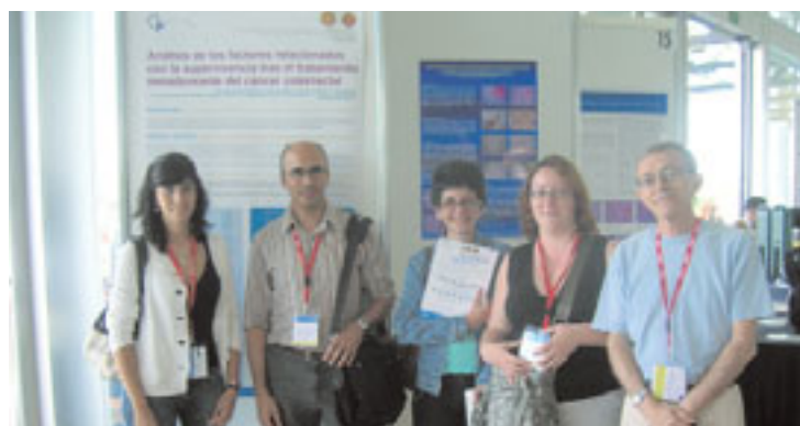
Especialistas de la FJD posan ante uno de los poster presentados en el congreso.