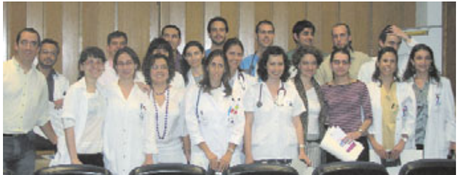
Los Residentes posaron para una foto de recuerdo.

En los siguientes días se desarrollaron varios Talleres de Adquisición y Prácticas de Habilidades Básicas.