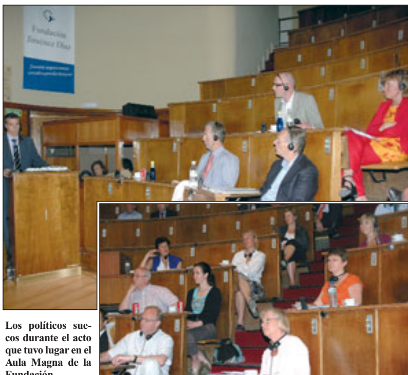
Los políticos suecos durante el acto que tuvo lugar en el Aula Magna de la Fundación.

El día siguiente, el grupo visitó el Hospital de Capiro en Valdemoro, donde prosiguieron las presentaciones.