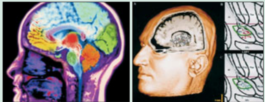
La Unidad de Trastornos del Movimiento cuenta con las técnicas más avanzadas para el diagnóstico y tratamiento del Parkinson y Movimientos anormales.

La Fundación Jiménez Díaz cuenta con una Unidad de Trastornos del Movimiento (UTM) creada para ofrecer un estudio específico y detallado a pacientes con Parkinson y movimientos anormales (incluyendo temblor, distonía, espasticidad, corea, mioclonías, tics y síndrome de piernas inquietas).