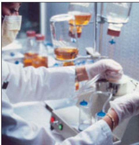
El laboratorio cuenta con todas las secciones para el diagnóstico microbiológico.

Su oferta se completa con un laboratorio de investigación, independiente del propiamente asistencial, en el que se llevan a cabo proyectos financiados desde