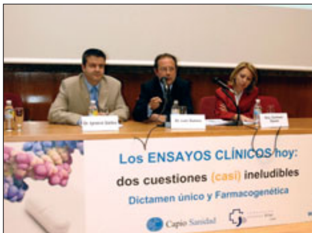
Mesa presidencial de la jornada sobre “los ensayos clínicos hoy: dos cuestiones (casi) ineludibles”.

La Farmacogenética, que estudia las características genéticas de las personas que les hacen reaccionar de modo diferente ante los fármacos –eficacia y toxicidad–, es un reto en la práctica de la nueva Medicina Genómica. Su incorporación reciente, pero masiva, a los ensayos clínicos, puede plantear cuestiones ético-legales, que deben ser resueltas, tras el