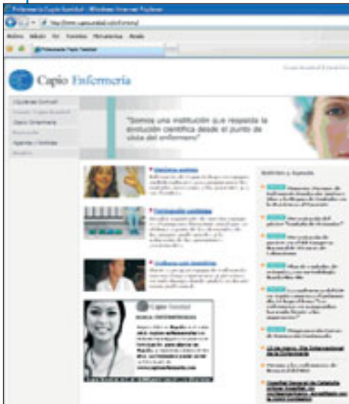
Pantalla de acceso a la página web.

Recientemente se ha presentado la nueva página web de Capiro Enfermería www.capioenfermeria.com