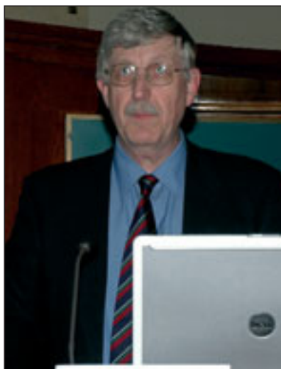
El Prof. Francis S. Collins durante su intervención en el Aula Magna de la FJD.

“ LA GENÓMICA PUEDE ACRECENTAR LAS DIFERENCIAS Y DESIGUALDADES ENTRE RICOS Y POBRES, ENTRE QUIENES TENGAN ACCESO A DETERMINADOS TRATAMIENTOS Y LOS QUE QUEDEN EXCLUIDOS DE ELLOS ”