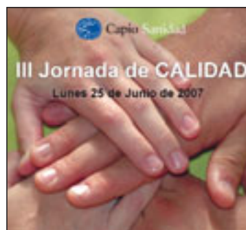
Cartel de la jornada.

En esta jornada, los profesionales de Capiro Sanidad se reúnen para revisar conceptos básicos de calidad asistencial y