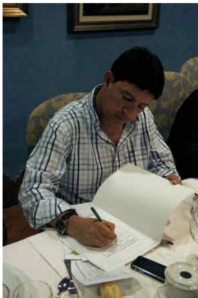
Un momento de la firma