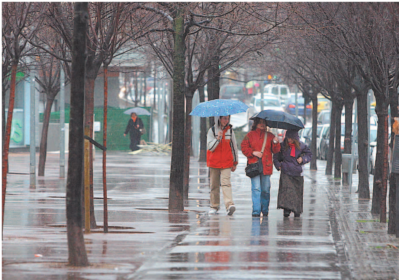
Los días pasados por agua pueden ser sinónimo de malestar articular y pesadez en el cuerpo y la cabeza.

TEXTO: EMILI GONZÁLEZ