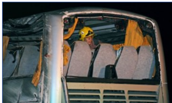
Algunos de los heridos serán trasladados a Holanda al mejorar su estado de salud

Los trece heridos que hoy serán trasladados a Holanda estaban ingresados en los hospitales barceloneses de Calella (siete), Mataró (dos), Vall d'Hebrón de Barcelona (1), Germans Trias i Pujol (1), Josep Trueta (1) y Granollers (1).