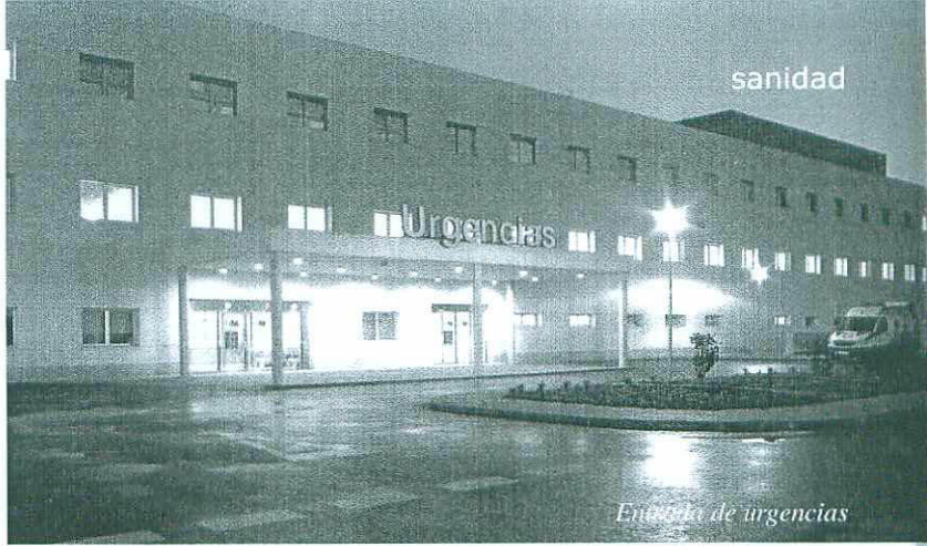
Entrada de urgencias