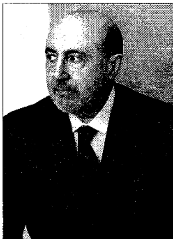
Luis Roldán fue un impostor no patológico.

mo presidente de una asociación y Marco como un hombre común. "Hay una línea tenue entre el engaño y la simulación, en la que se incorporan rasgos disociativos, que es la razón por la que una persona puede tener dos contenidos mentales incompatibles entre sí".