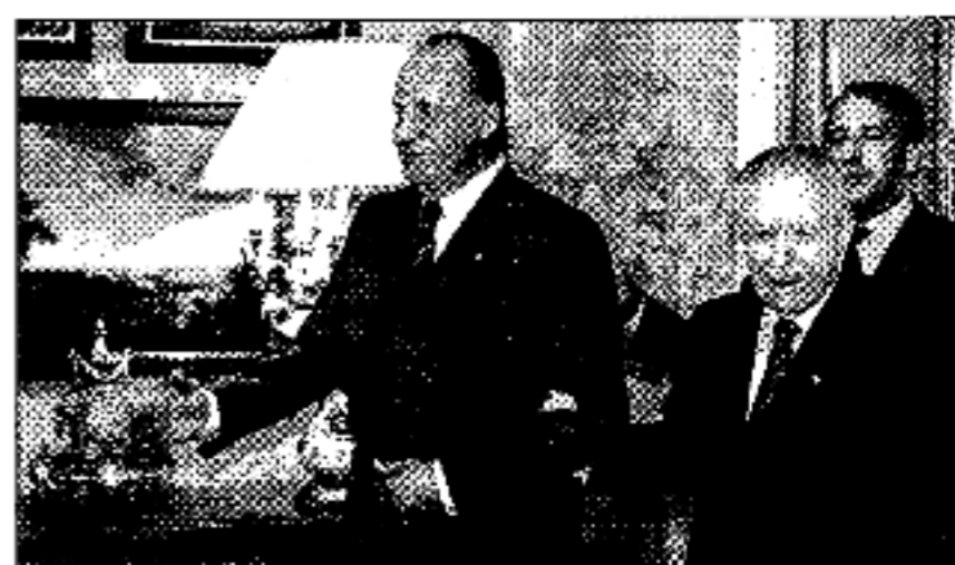
El Rey, ayer, junto con el presidente de Italia, Carlo Azeglio Ciampi.

Actualmente, un centenar de jóvenes procedentes de España y otros países cursan sus estudios en las distintas cátedras, una enseñanza que se complementa con la presencia de grandes maestros invitados a compartir lecciones magistrales y con la participación de los alumnos en cerca de 200 conciertos públicos por salas de toda España.