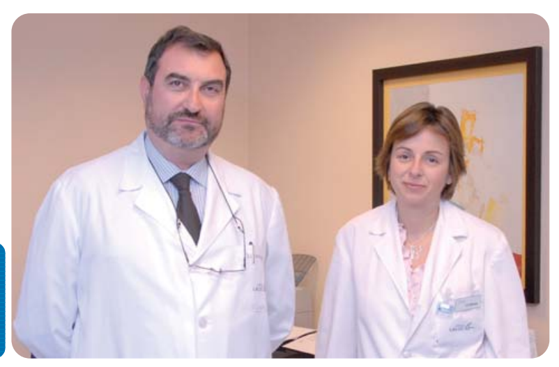
Equipo de la Unidad de PET-TAC

Estas tres Unidades trabajan en colaboración con los diferentes Servicios y Unidades que dispone la Clínica y que cubren todas las especialidades y sus respectivas necesidades.