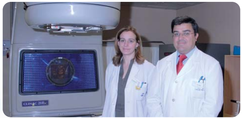
Equipo de radiofísicos de la Unidad de Oncología Radioterápica

2. Oncología Radioterápica, que coordina el estudio, el diagnóstico y aplicación los tratamientos con radiaciones ionizantes con las más sofisticadas técnicas en todo tipo de tumores, planificando la atención integral con el resto de las especialidades.