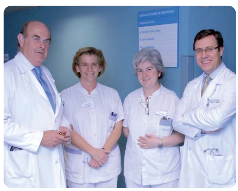
Parte del equipo del Unidad de Oncología Médica

Oncología Médica, que coordina el estudio, el diagnóstico y la aplicación de los tratamientos sistémicos, planificando la atención integral junto con el resto de especialidades implicadas.